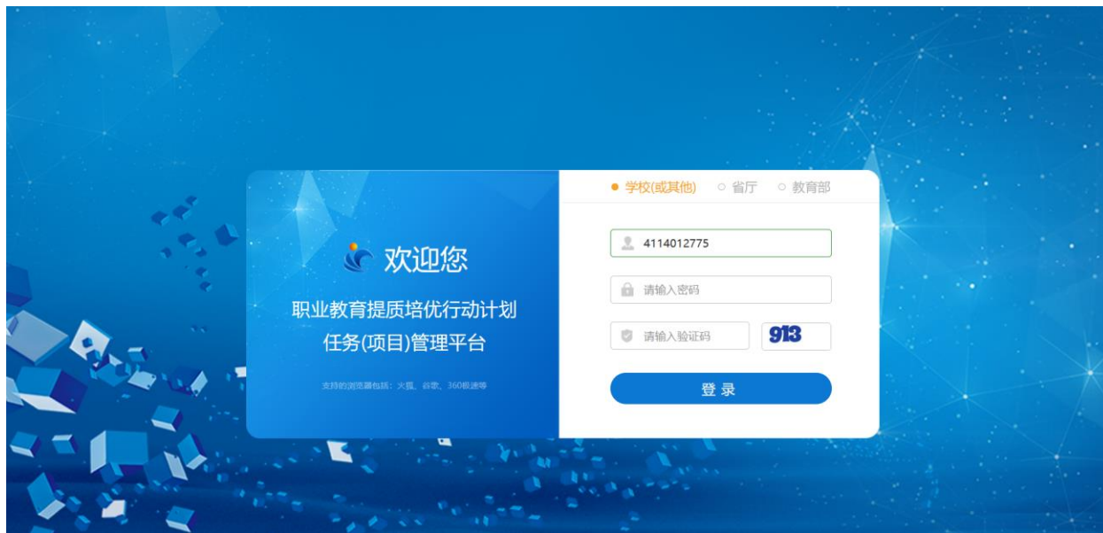
图 管理平台网站页面

http://tizhipeiyou.36ve.com ， 建议用火狐、谷歌、360 极速浏览器登录 。管理平台网站登录页面如下图所示：